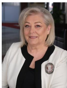
Akademie Justina Shiroka-Pula Nënkryetare