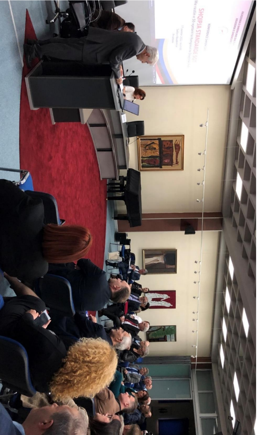
Hapja e Konferencës