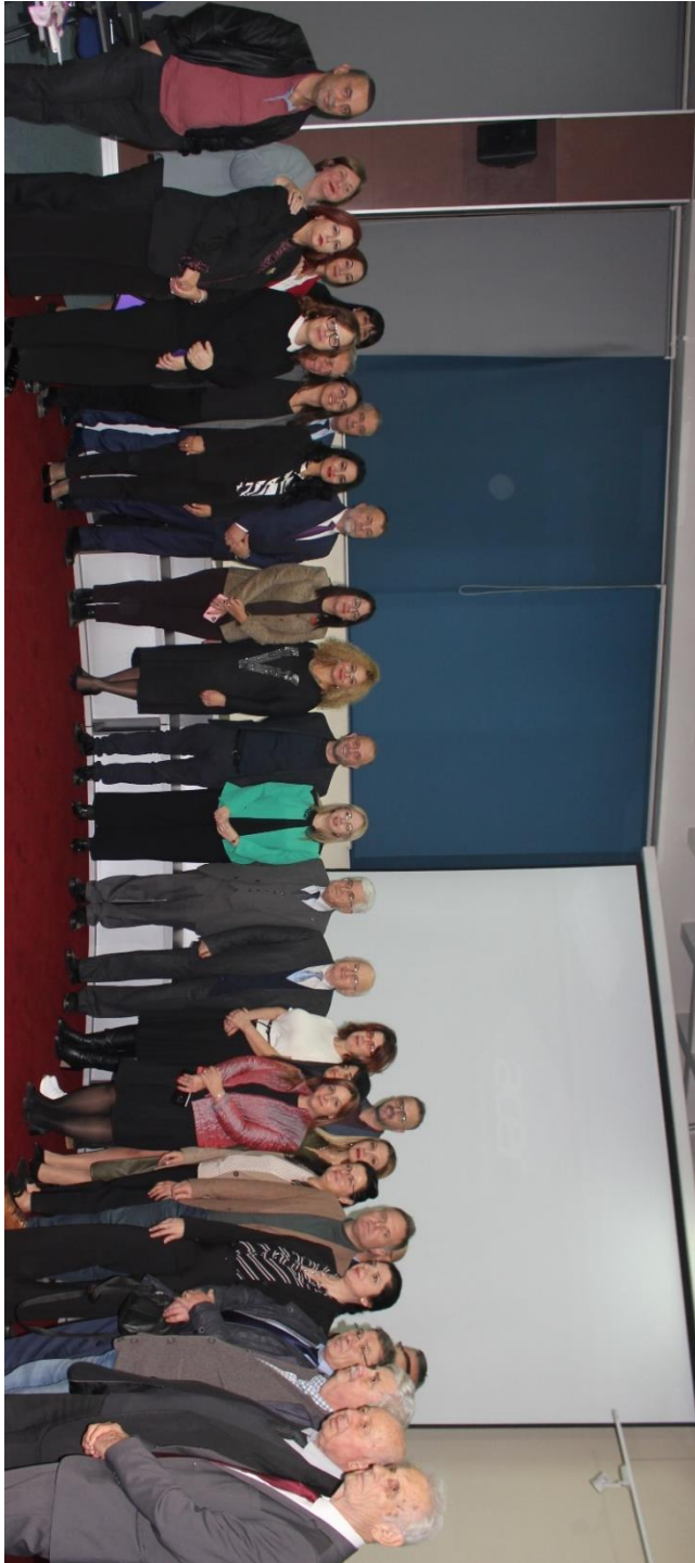
Pjesëmarrës të Konferencës