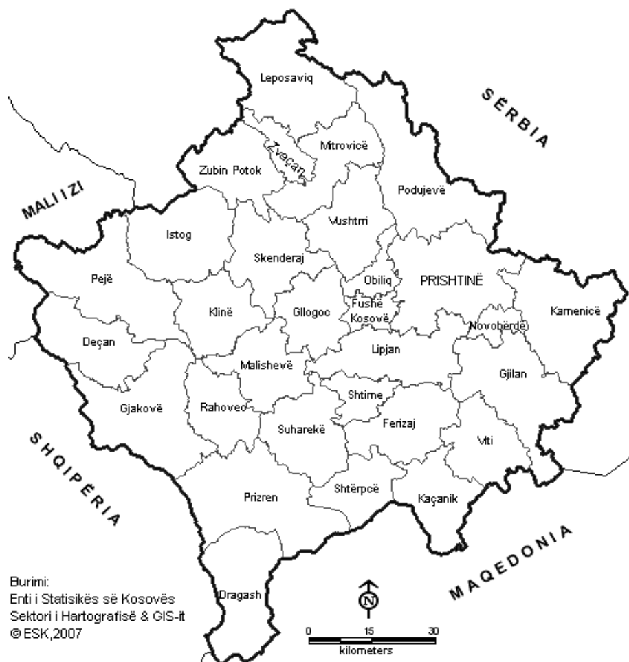
Ndarja territoriale-administrative e Kosovës në vitin 1991(30 komuna)