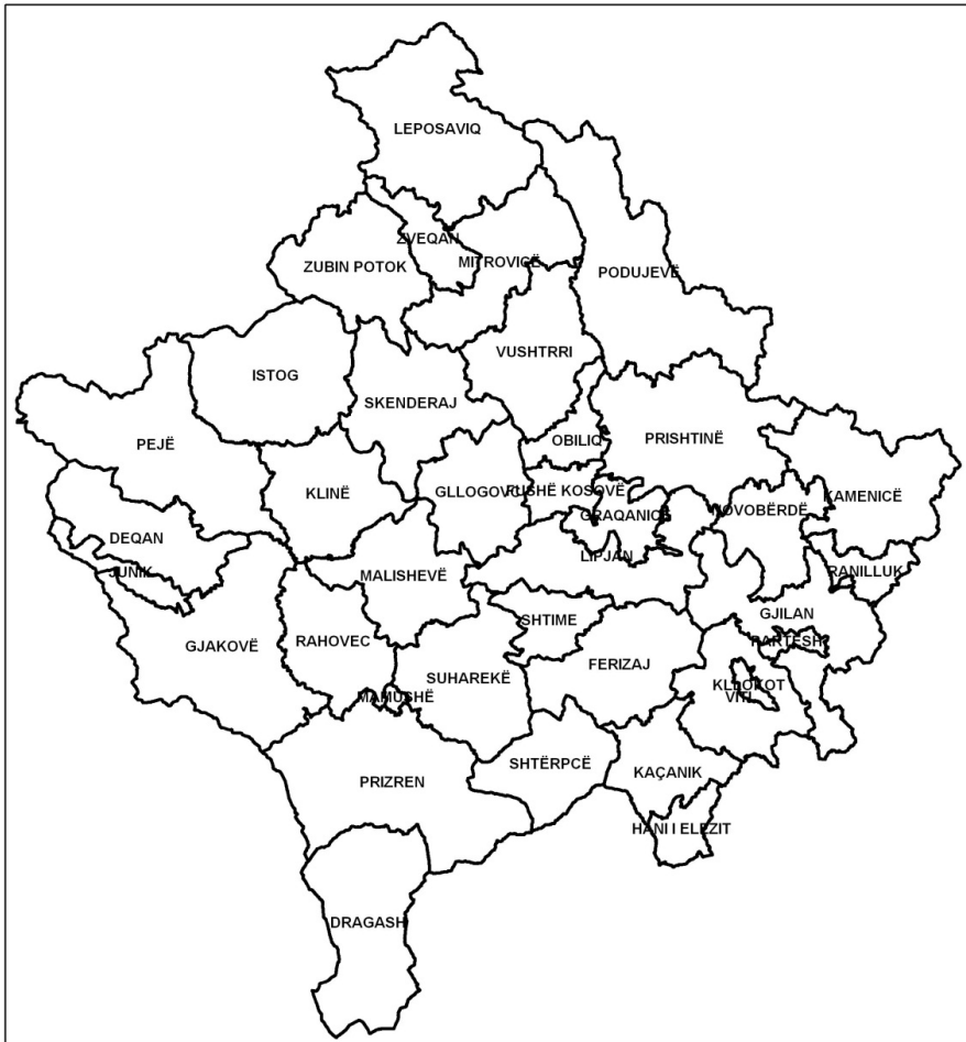
Ndarja territoriale-administrative e Kosovës në vitin 2010 (38 komuna)