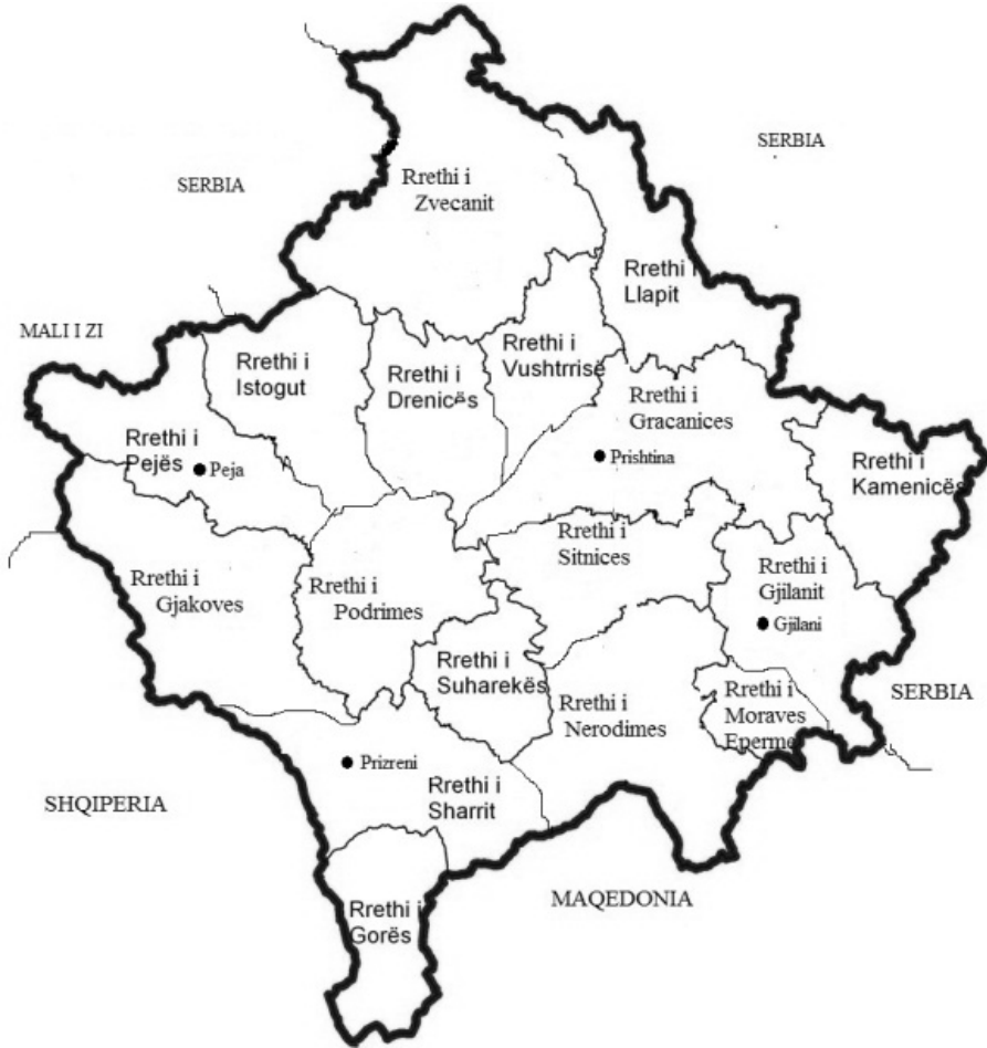
Ndarja territoriale-administrative e Kosovës në vitin 1953

Rrethi i Istogut: Banja, Cërkolezi, Ujëmiri, Dobrusha, Dubrava, Gjurakovci, Istogu, Jashanica, Klina, Jabllanica e Vogël, Rakoshi, Vrella, Zllokuqani dhe Zallqi.