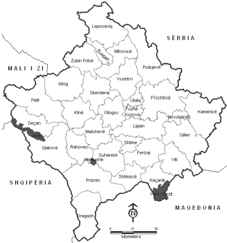
Ndarja territoriale-administrative e Kosovës në vitet 2005 – 2008 (33 komuna)

kushtuar kujdes të posaçëm nevojave dhe brengave të komuniteteve joshumicë në Kosovë. UNIMIK-u dhe Qeveria e Kosovës në vitin 2005 miratuan dokumentin kornizë për reformimin e pushtetit lokal dhe decentralizimin.