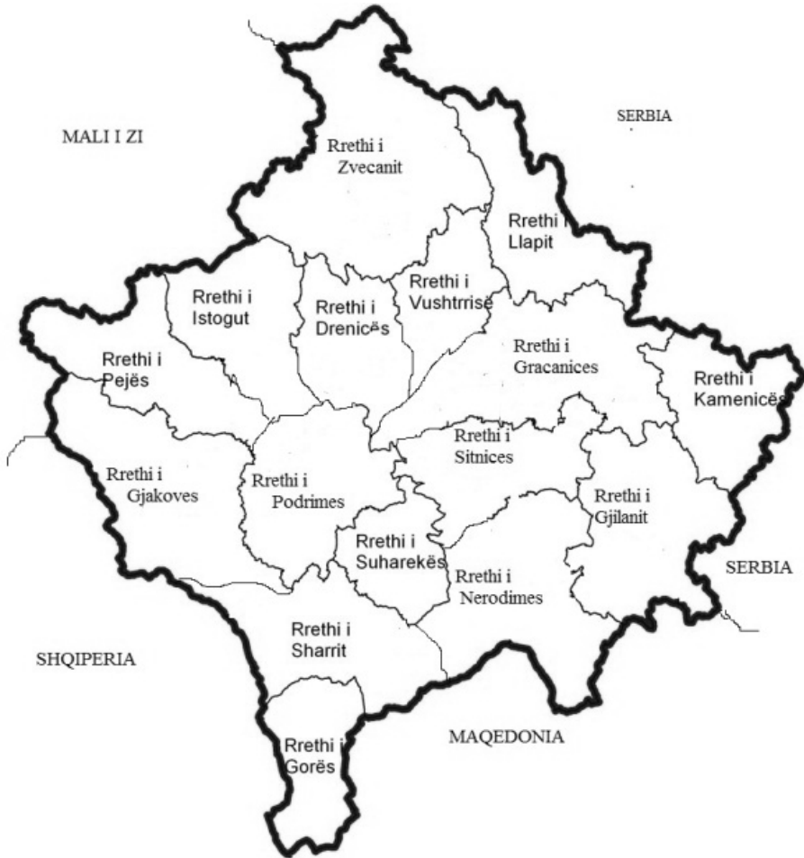
Ndarja administrative-territoriale e Kosovës në rrethe më 1947 (16 rrethe)

prill 1947 27 është përcaktuar se njësitë administrative-territoriale janë: rrethet, qytetet, rajonet e qyteteve. Me këtë Ligj janë suprimuar qarqet si njësi administrative-territoriale, kështu që organet republikane drejtpërsëdrejti lidhen me rrethet.