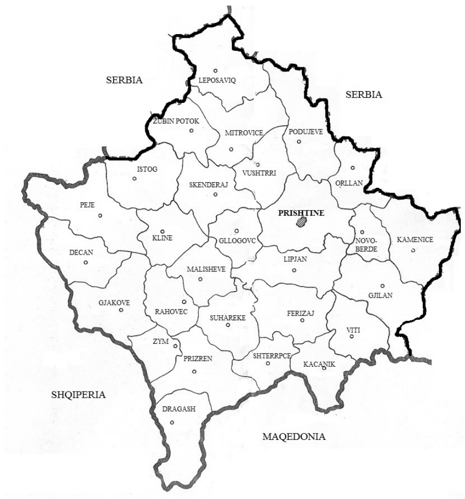
Ndarja administrative territoriale e Kosovës në komuna në vitet 1960-1965 (28 komuna)

Tani në territorin e Kosovës funksionojnë 22 kuvende komunale. Në vitin 1966 në Kosovë ekzistojnë këto komuna: e Deçanit, Dragashit, Gjakovës, Gjilanit, Ferizajt, Prishtinës, Pejës, Mitrovicës, Kamenicës, Vitisë, Podujevës, Suharekës, Rahovecit, Vushtrrisë, Istogut, Klinës, Kaçanikut, Lipjanit, Skënderaj, Glllogovcit, Leposaviqit dhe Prizrenit.