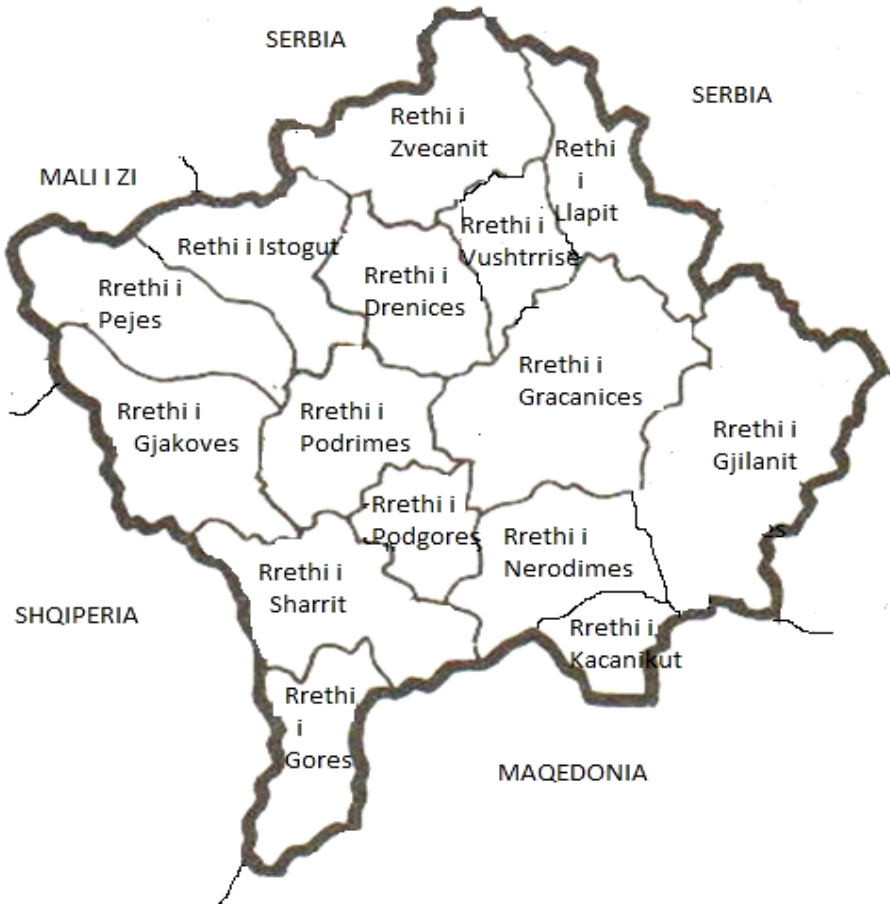
Ndarja territoriale-administrative e Kosovës në vitin 1945 në 15 rrethe

zhvillimin e tyre ekonomik, kulturor dhe social në territorin e vet dhe kanë udhëhequr me pasurinë e përgjithshme popullore të karakterit lokal. Organ ekzekutiv i rrethit ka qenë Këshilli Ekzekutiv.