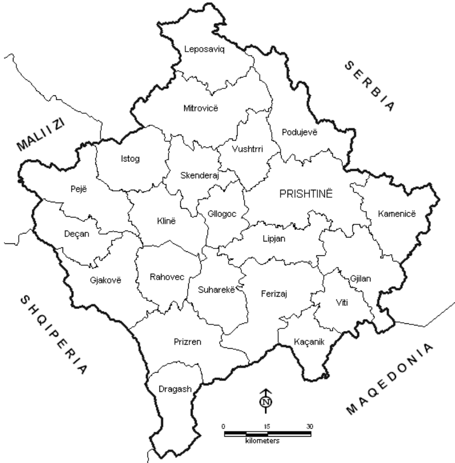
Ndarja territoriale-administrative e Kosovës në vitet 1966-1984 (22 komuna)

Komunat të tjera, ajo e Zymit i bashkëngjitet komunës së Prizrenit, komuna e deritanishme e Shtërpçës i bashkëngjitet komunës së Ferizajt dhe vendbanimet e komunës së Zubin Potokut i bashkëngjiten komunës së Mitrovicës. Vendbanimet e komunës së Malishevës ndahen ndërmjet komunave të Rahovecit, Suharekës, Klinës dhe Drenasit.