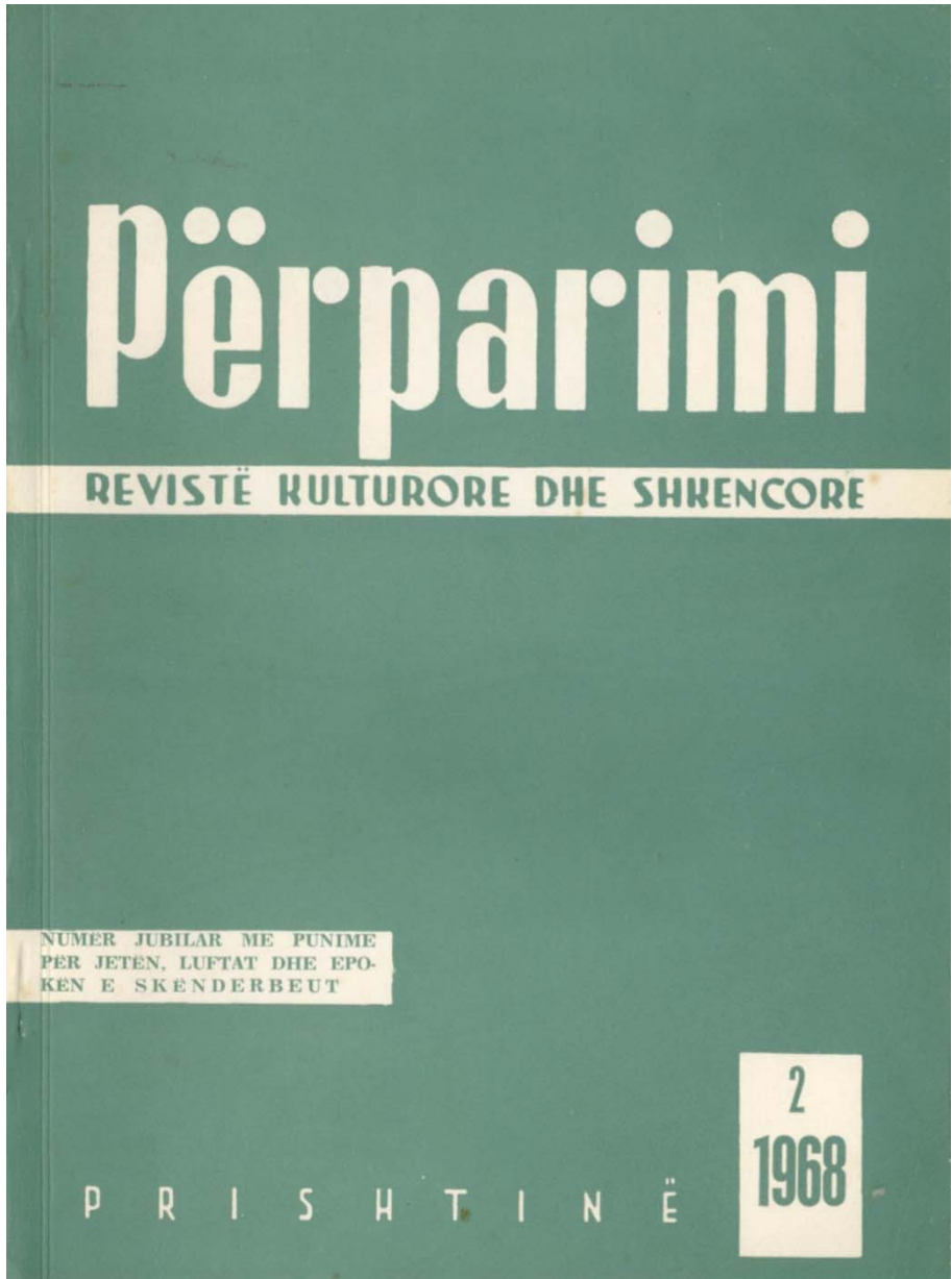
Revista "Përparimi" 1968 nr. 2